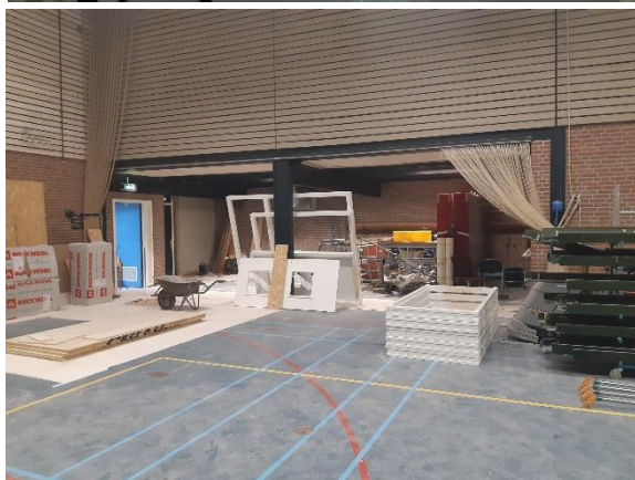
Verbouwing de Willaert juli 2020

Na de verbouwing wordt er ook een compleet nieuwe vloer in de Willaert sportzaal gelegd!